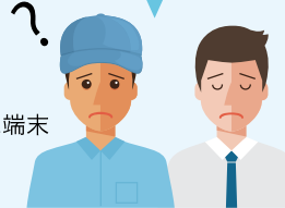
生産設備管理者 システム担当者様