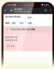
乗務員へのメール通知