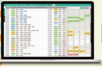
パソコンから配車計画を入力