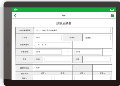
紙帳票と同じ見た目を表示！