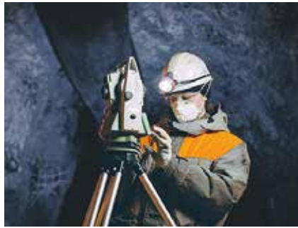
接続圏外エリア 地下 / トンネル など