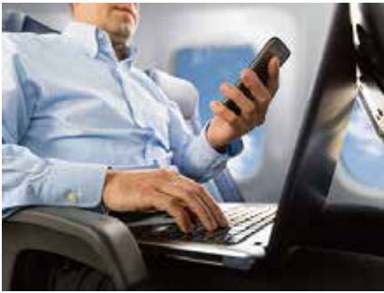
接続不安定エリア 電車 / 飛行機 など