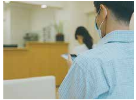
通信規制エリア 病院 / データセンター など